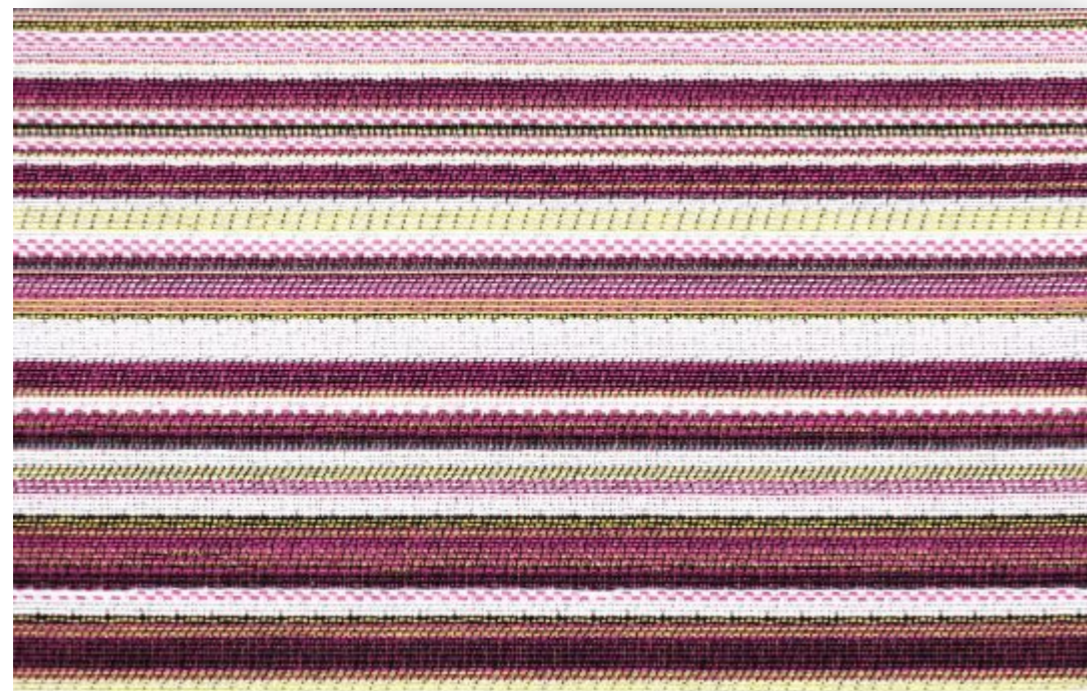
Flatline - 804.395