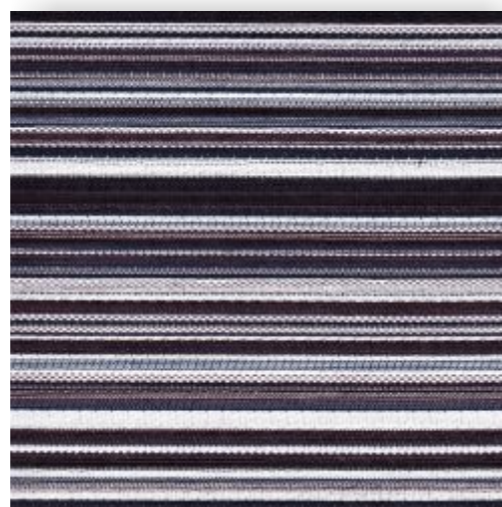
Flatline - 804.423