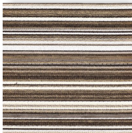
Flatline - 804.667