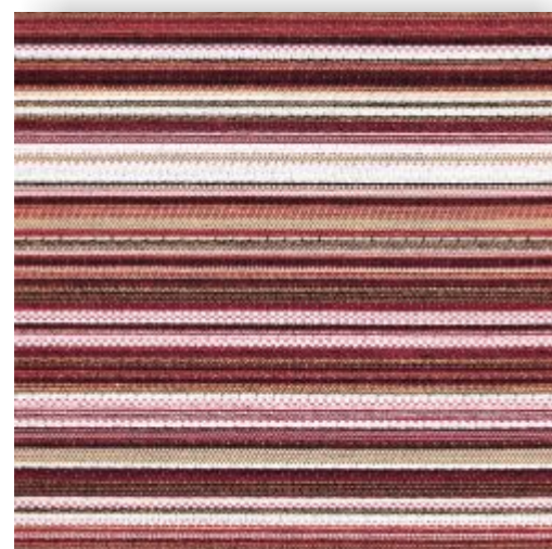
Flatline - 804.412