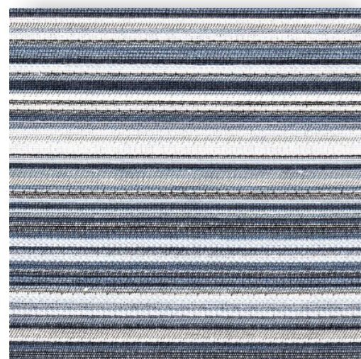
Flatline - 804.413